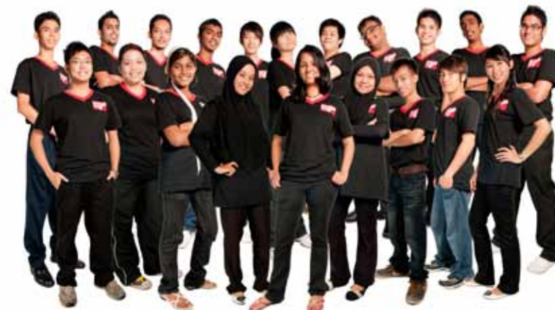
HDF Tahun 2010.

Semuanya bermula dengan Encik Soichiro Honda dan impiannya. Impian beliau inilah yang telah menjadikan Honda seperti hari ini; sebuah syarikat yang mengeluarkan motosikal, kereta, jet, kereta lumba dan robot seperti manusia (Humanoid) yang pertama – ASIMO. Dalam usaha untuk memenuhi tanggungjawab sosialnya dan dikenali sebagai sebuah syarikat yang masyarakat inginkan kewujudannya, Honda sentiasa aktif dalam menyertai pelbagai program bantuan. Di bawah Inisiatif Kedermawanan Global Honda , syarikat ini telah menyumbang ke arah kesejahteraan masyarakat melalui pelbagai projek persekitaran, kemasyarakatan, kemanusiaan dan pendidikan.